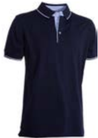
Blu Navy 021