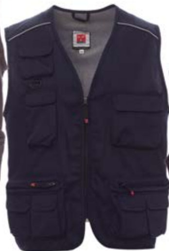
*Blu Navy 021