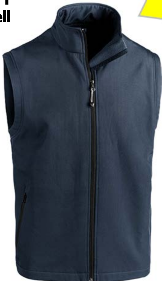
Blu Navy 021