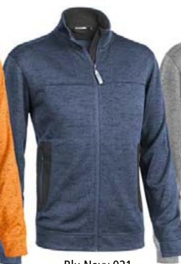
Blu Navy 021