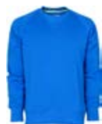
Blu Royal 022