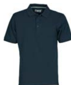
*Blu Navy 021