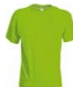
Verde Acido 080