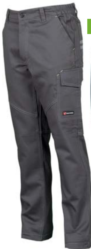
Grigio Scuro 132