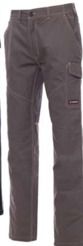
Grigio scuro 132