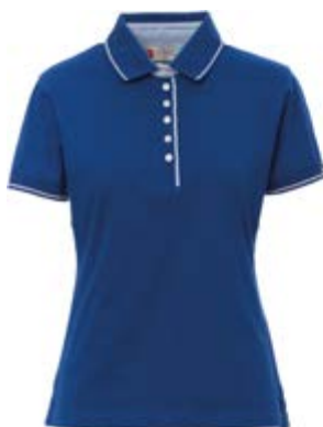
Blu Royal 022