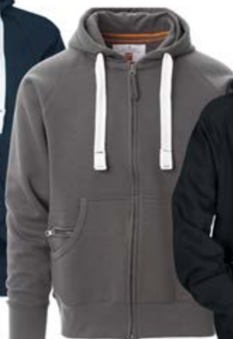
*Grigio Scuro 132