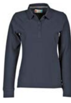
Blu Navy 021