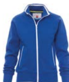
Blu Royal 022