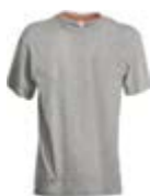
*Grigio Melange 041