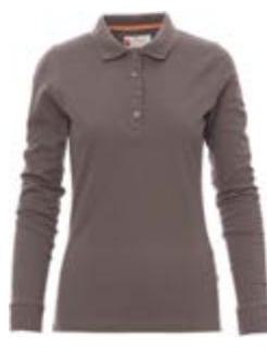
Grigio scuro 132