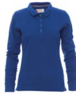
Blu Royal 022