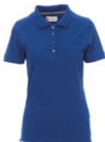
Blu Royal 022