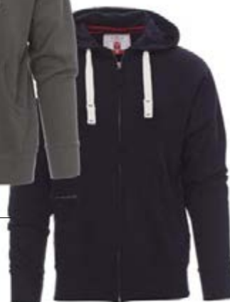
Blu Navy 021