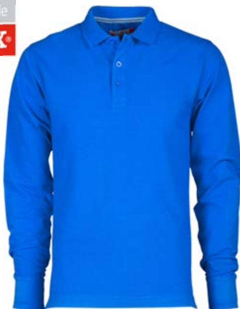
*Blu Royal 022