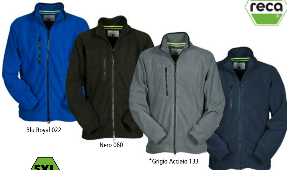
Blu Royal 022