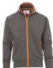
*Grigio scuro 132