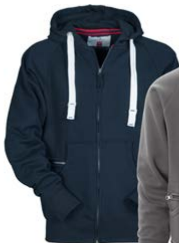
*Blu Navy 021