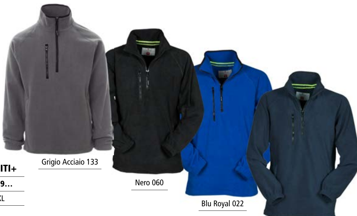
Grigio Acciaio 133

Ricamo e serigrafia, lato SX, schiena e spalla