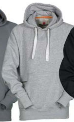
Grigio Melange 041