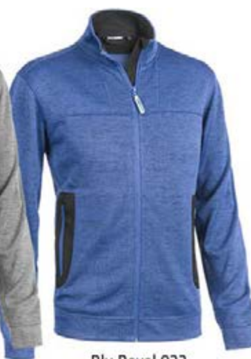
Blu Royal 022