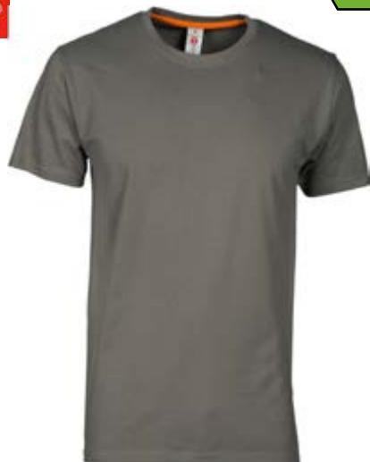
*Grigio scuro 132