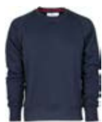
Blu Navy 021