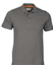
*Grigio scuro 132