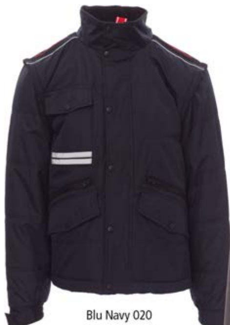
Blu Navy 020