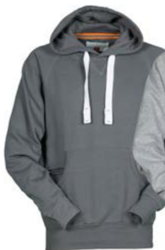
Grigio Scuro 132

Ricamo, DFT e serigrafia lato DX / SX, schiena e spalla