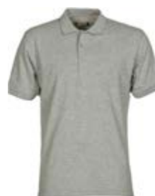
*Grigio Melange 041