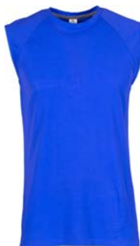
Blu Royal 022