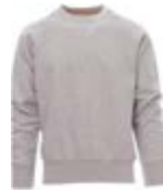
Grigio Melange 041