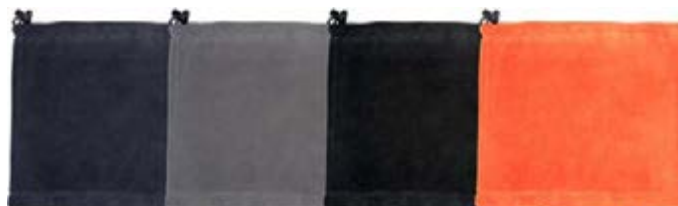
Blu Navy 021