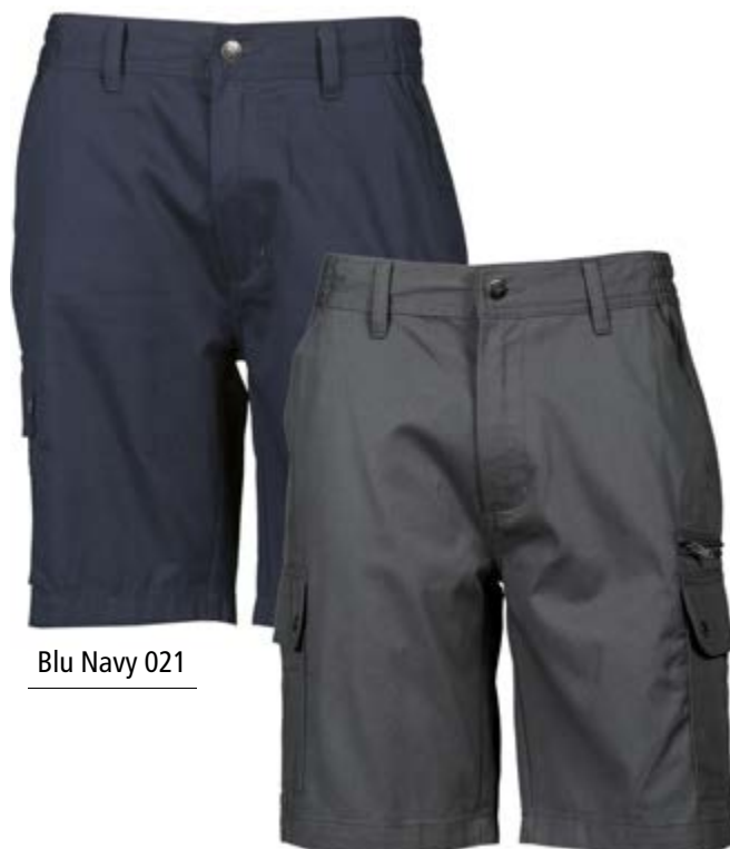
Blu Navy 021