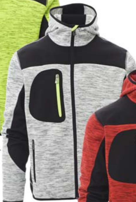
Grigio Melange 041