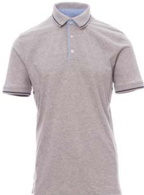
Grigio Melange 041