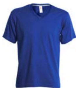
Blu Royal 022

Ricamo, DTF o serigrafia: lato SX/DX, spalle schiena