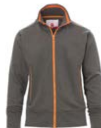
Grigio scuro 132