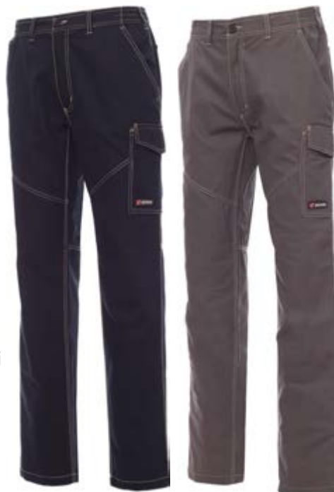
*Blu Navy 021