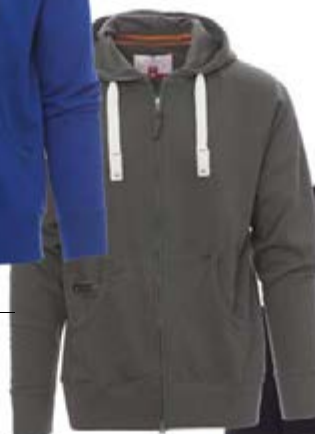
Grigio scuro 132