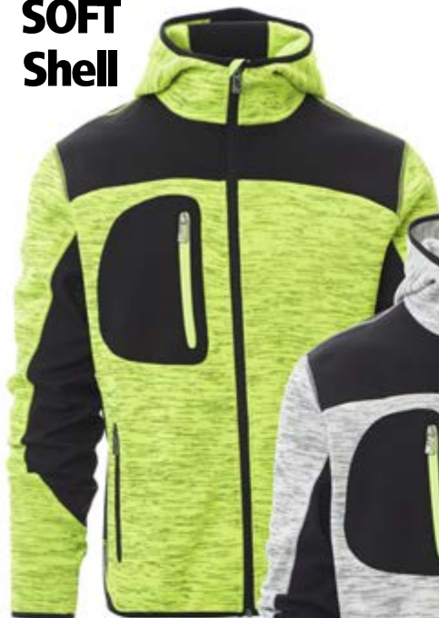
Giallo Fluo 145