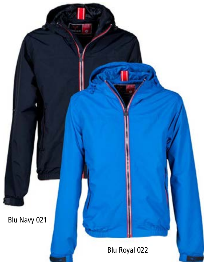
Blu Navy 021