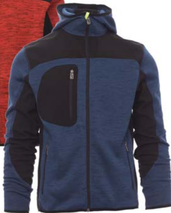
Blu scuro 023