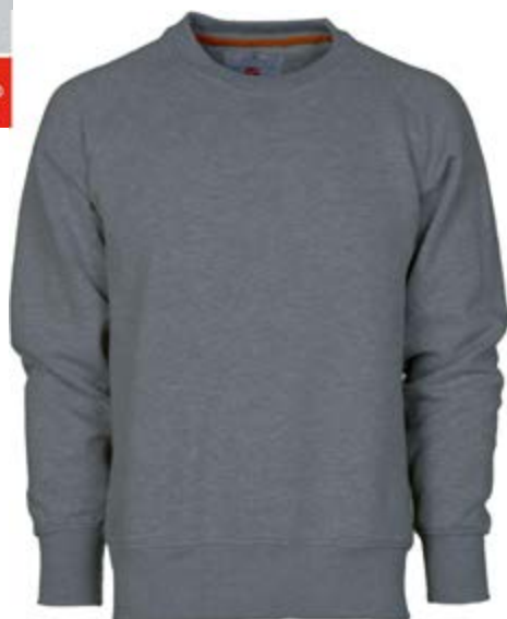
Grigio Scuro 132