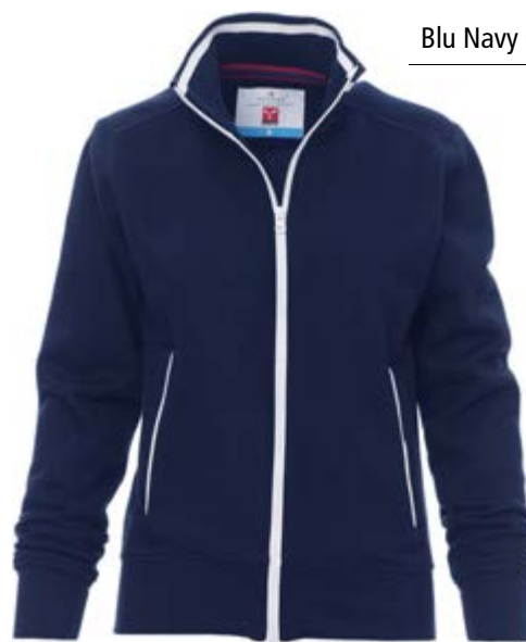
Blu Navy 021

Ricamo, DTF e serigrafia ad i colore: petto SX/DX, spalle, schiena