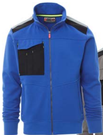
Blu Royal 022