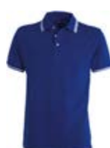
Blu Royal 022