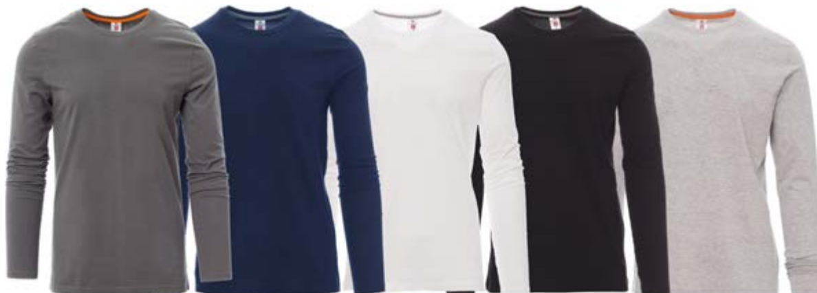
Grigio scuro 132