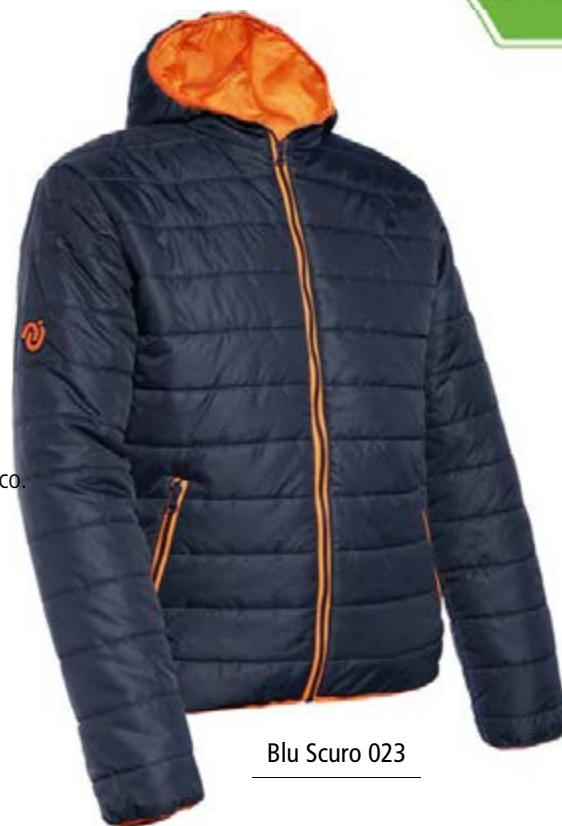
Blu Scuro 023