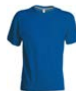
*Blu Royal 022