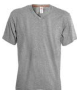
Grigio Melange 041