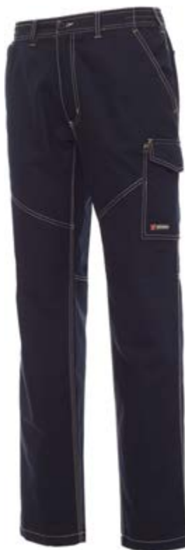
Blu Navy 021

Ricamo e serigrafia, lato destro tra le tasche