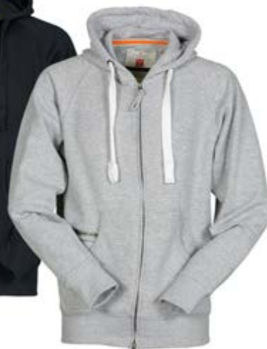
Grigio Melange 041