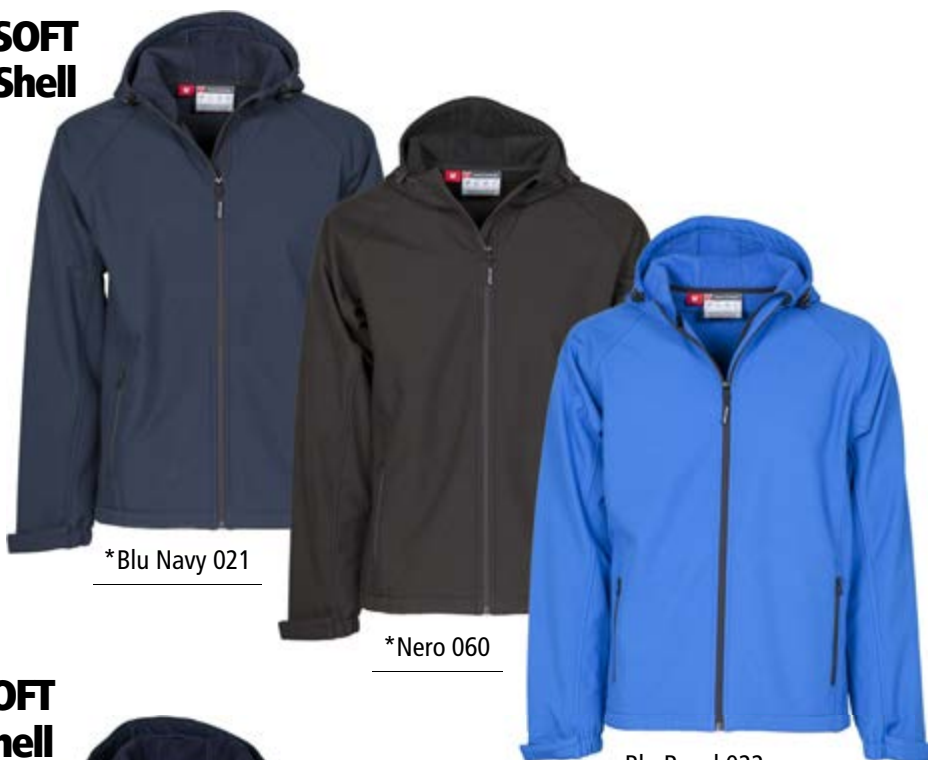
*Blu Navy 021