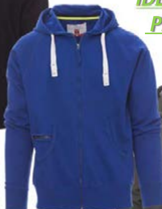
Blu Royal 022