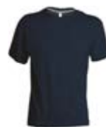
*Blu Navy 021