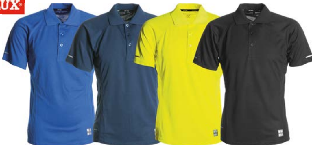
Blu Royal 021