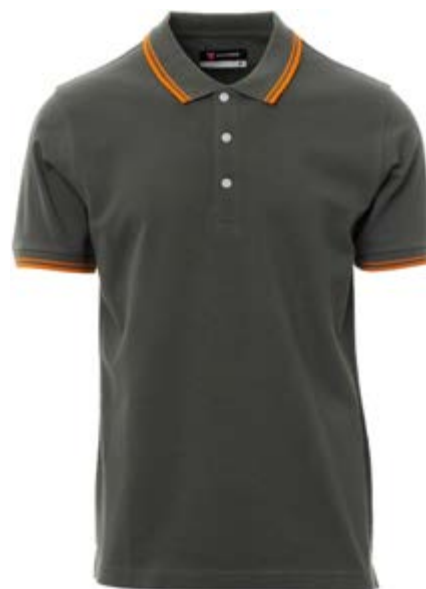
Grigio scuro 132

Ricamo o serigrafia, lato SX/DX, schiena e spalle