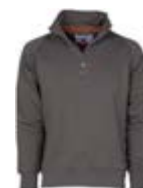
*Grigio Scuro 132