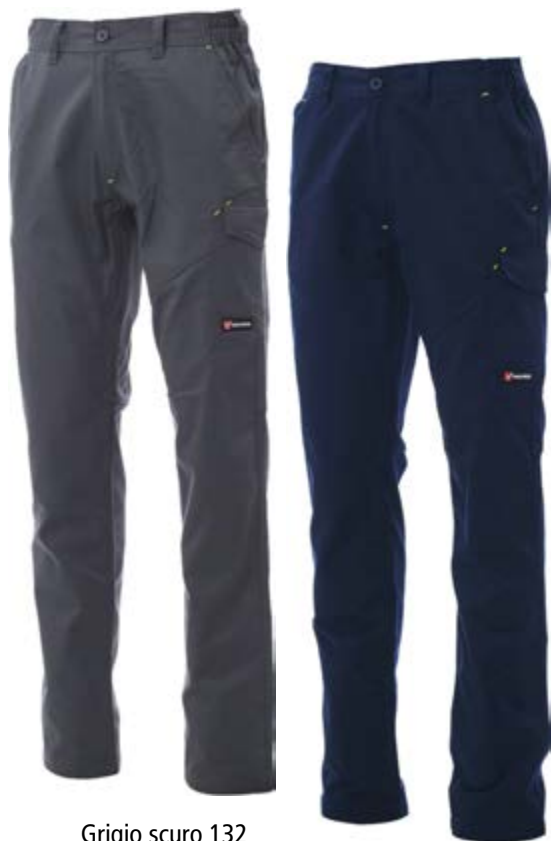
Grigio scuro 132