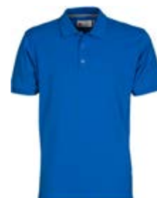
*Blu Royal 022