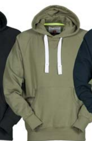
Verde Militare 082