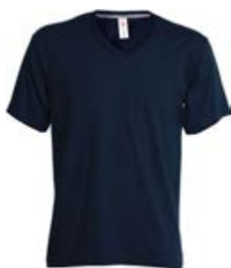
Blu Navy 021