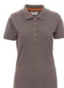
*Grigio scuro 132