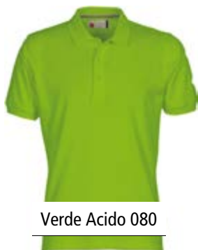
Verde Acido 080