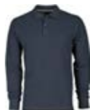
*Blu Navy 021