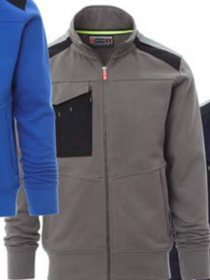
Grigio scuro 132