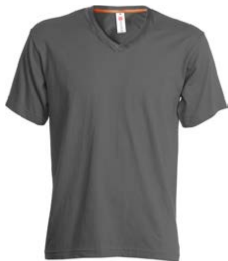
Grigio scuro 132