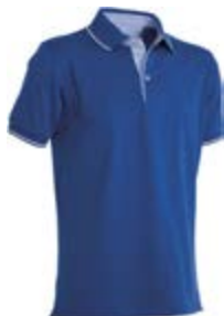
Blu Royal 022